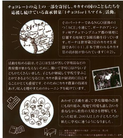
中面（二つ折り/キャンペーン趣旨記載）