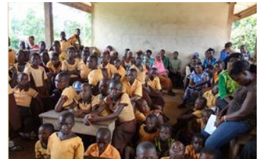
ガーナでの教育環境整備

★詳しくは「1 チョコ for 1 スマイル」公式サイトをご覧ください。 ( http://1choco-1smile.jp )