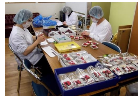
てんとう虫チョコを袋詰めする あすなるホームのみなさん