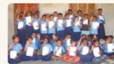
子ども肌着を手にするインドの子どもたち

インドの子どもたちに子ども肌着を支援 コットン生産地の児童労働をなくすためにACE様が活動されているインドの子どもたちに肌着200枚を支援しました。衛生教育の一つとして活用いただき、子どもたちにも喜んでいただきました。