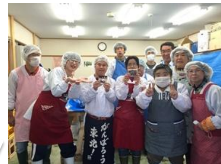
利用者のみなさん (2015年11月訪問時)