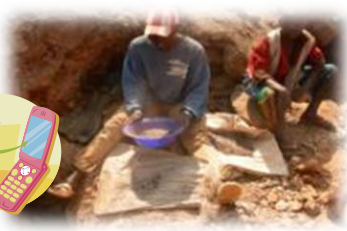
コルタン鉱石(タンタル) (コンゴ民主共和国)