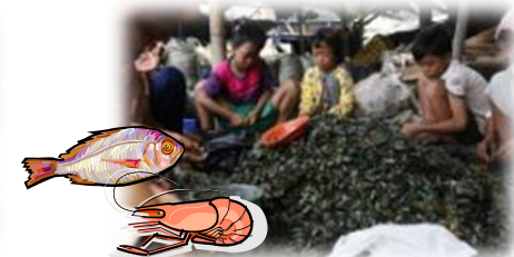
漁業 (インドネシア)