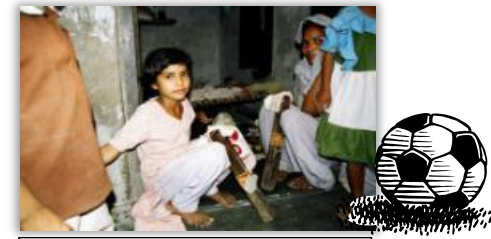
サッカーボール(インド)