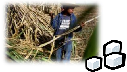
さとうきび(ボリビア)