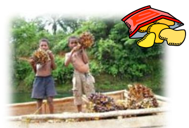
パームやし (パプアニューギニア)